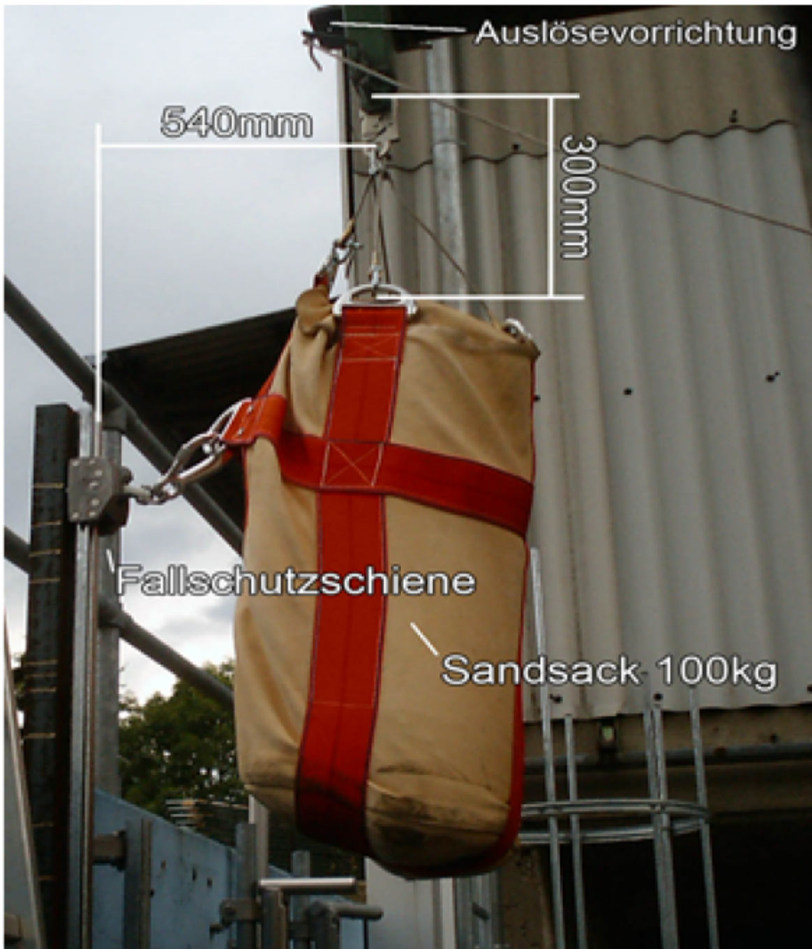
Abb1. Positionierung des Prüfgewichts