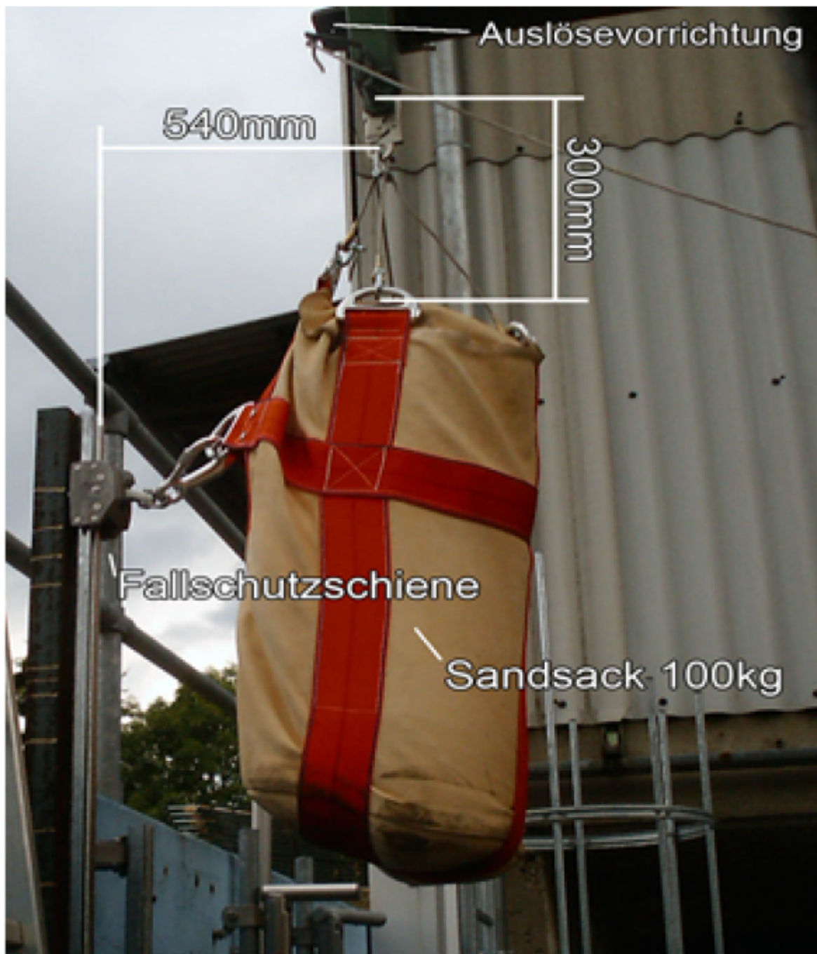
Abb1. Positionierung des Prüfgewichts