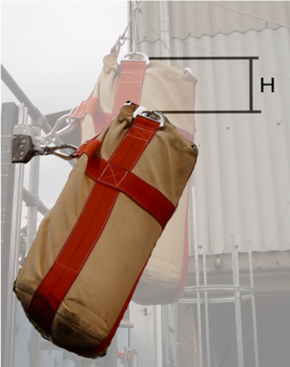
Abb2. Definition des Maß H