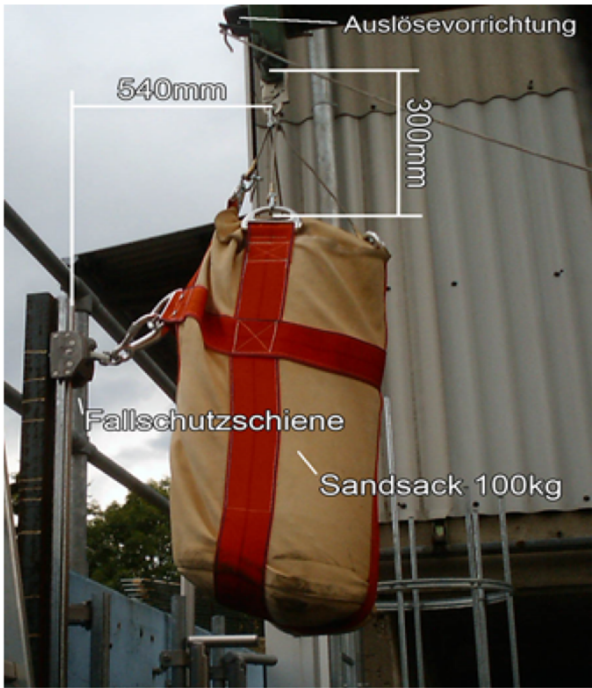
Abb1. Positionierung des Prüfgewichts