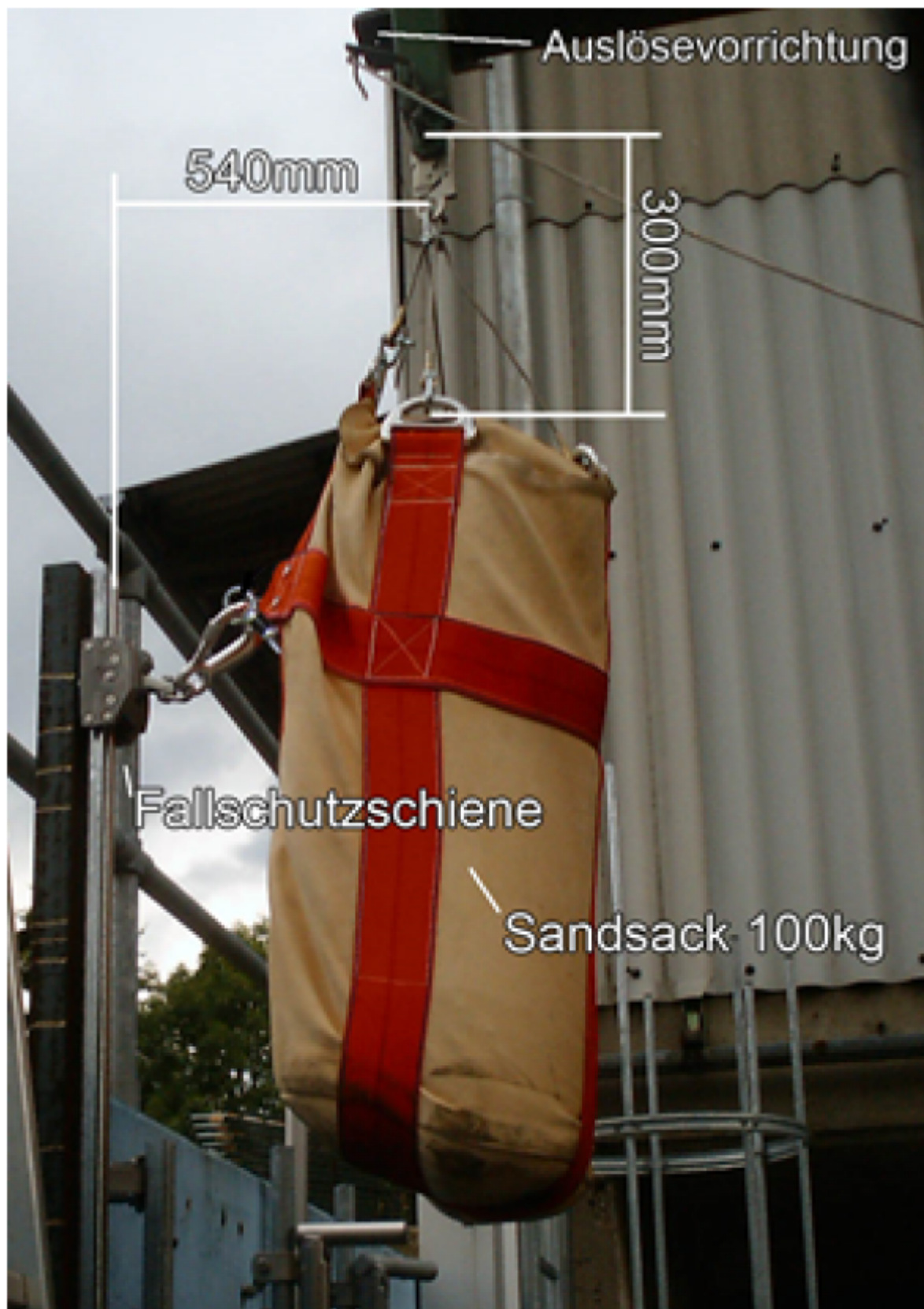
Abb2. Positionierung der Prüfgewichts