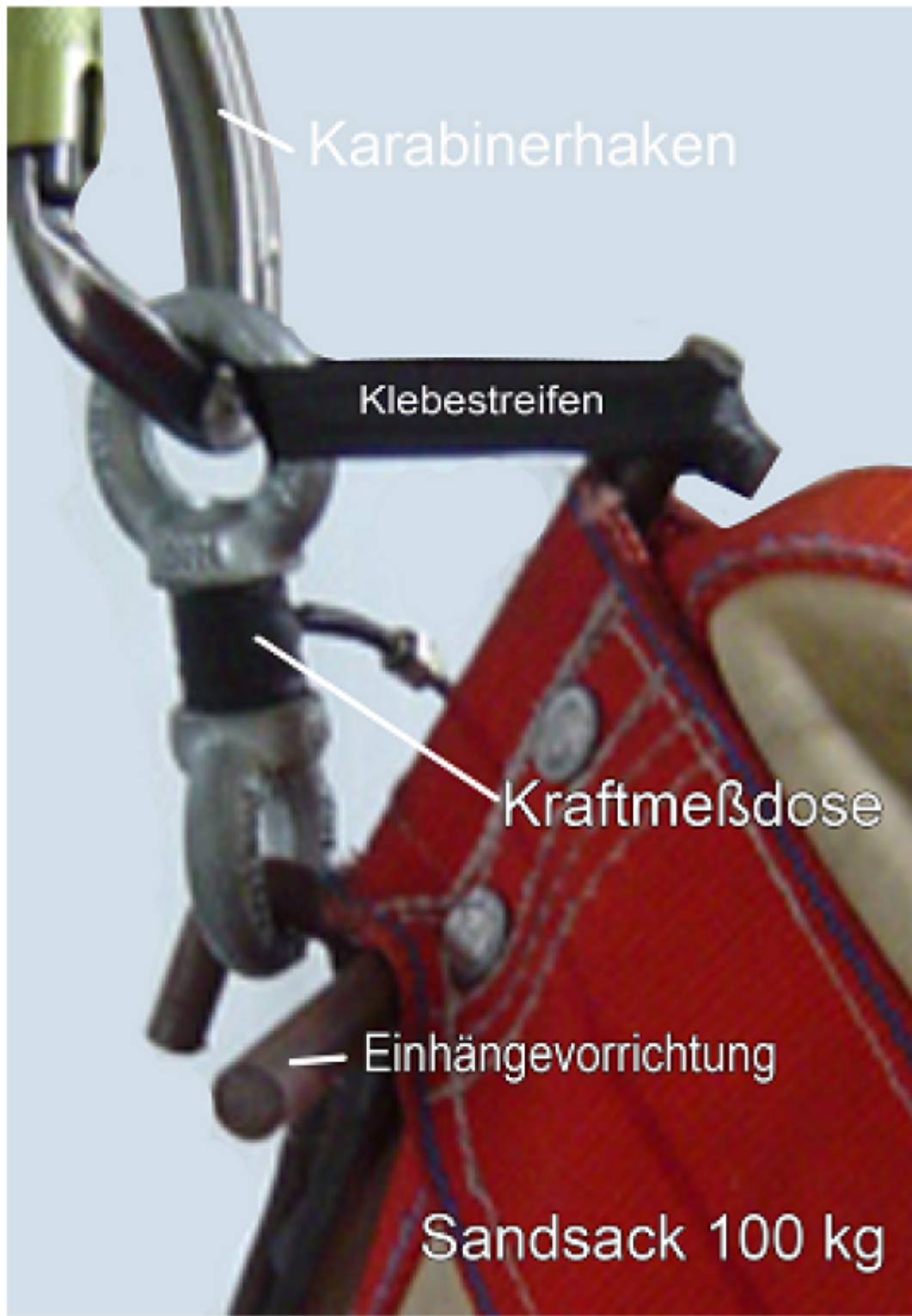
Abb1. Sandsack mit Einhängegestange und Kraftmessdose