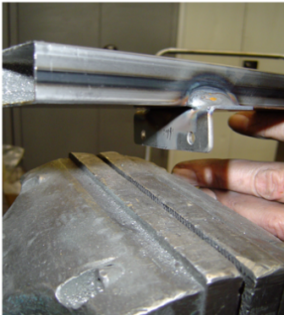
Bild Nr.1 Holm am Stufenwinkel in den Schraubstock einspannen.