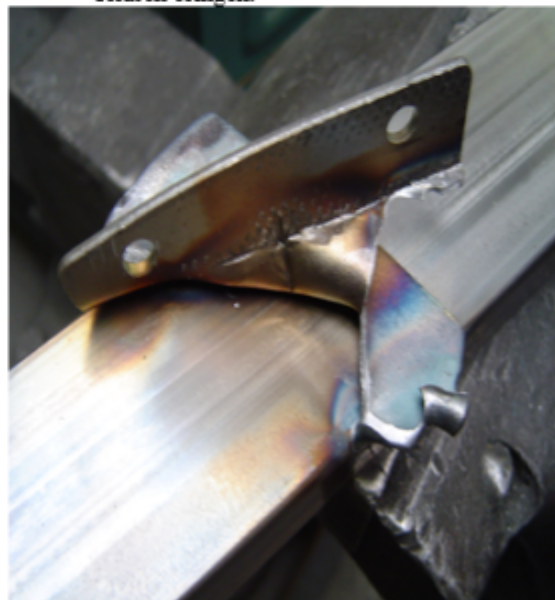
Bild Nr.4 Der Stufenwinkel ist gerissen.