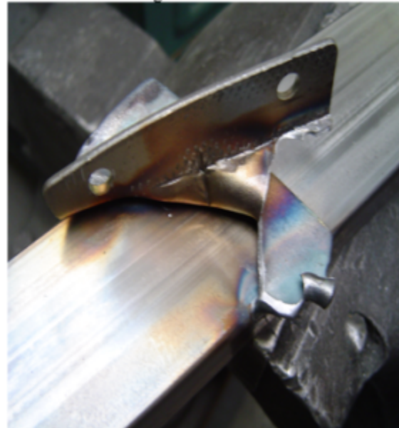
Bild Nr.4 Der Stufenwinkel ist gerissen.