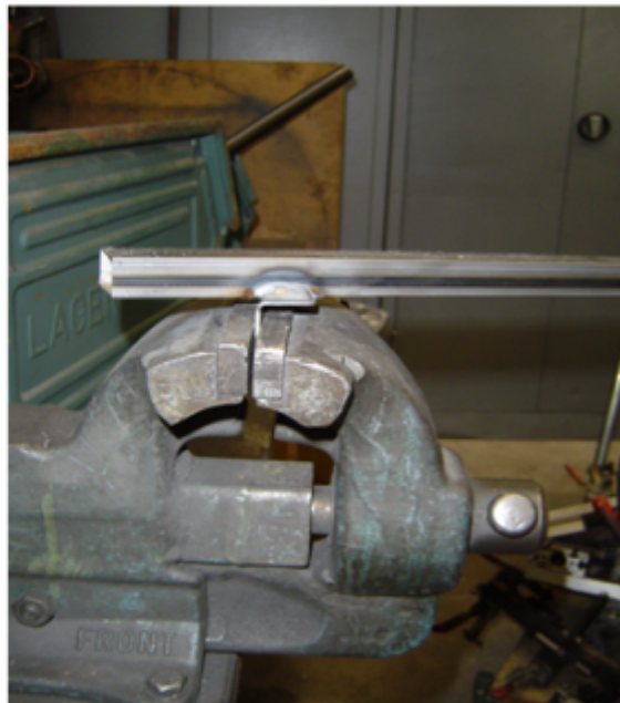
Bild Nr.2 Stufenwinkel durch verdrehen des Holmes zum Reißen bringen.