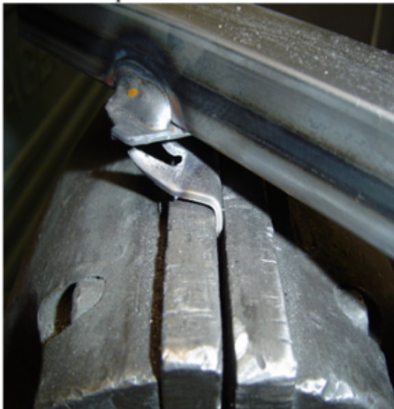
Bild Nr. 3 Die Schweißnaht bleibt unversehrt.