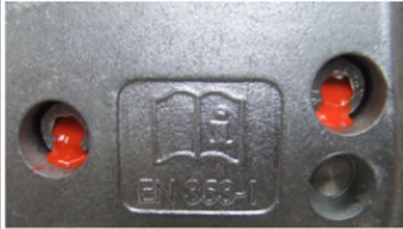
Foto 1: Detailaufnahme Gehäusehälfte rechts (Seitenansicht)

Der Schraubensicherungslack muss so aufgetragen werden, dass der Innensechskant der Zylinderkopfschraube sowie das Gehäuse mit dem Schraubensicherungslack bedeckt ist (siehe Foto 1).