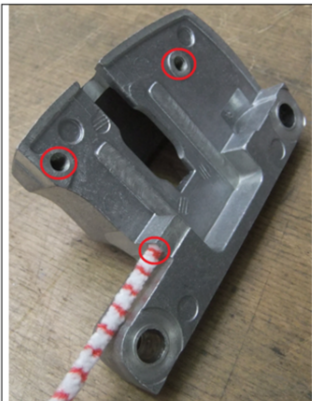
Foto 1: Griffteil (26/5242) mit markierten Punkten, die gereinigt werden sollen