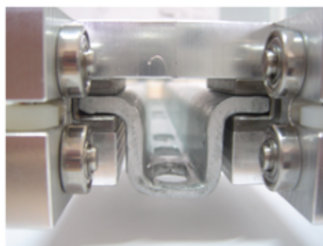
Bild Nr.3 Prüflehre- Aufschieben.