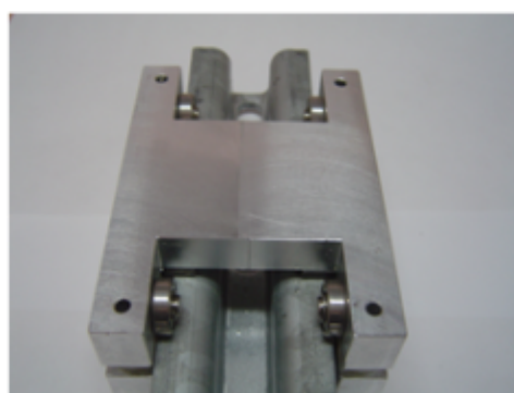
Bild Nr.4 Prüflehre über die gesamte Länge des Profils ziehen.