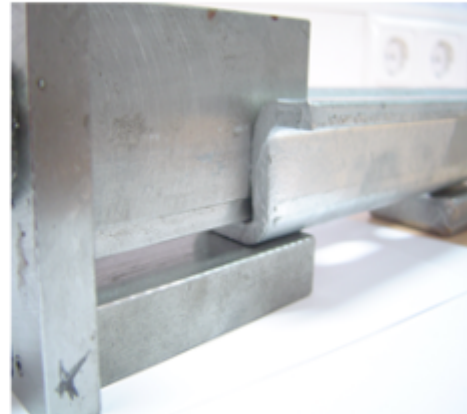
Bild Nr.2. Ansetzen der Prüflehre.