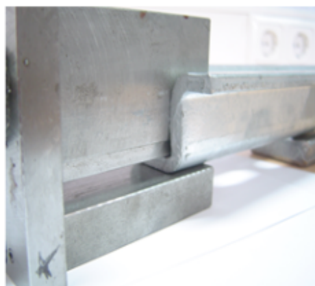
Bild Nr.2. Ansetzen der Prüflehre.