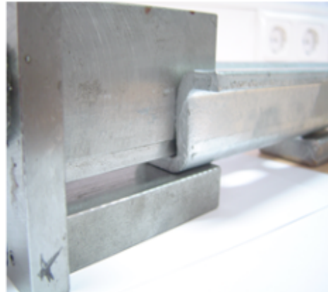
Bild Nr.2. Ansetzen der Prüflehre.