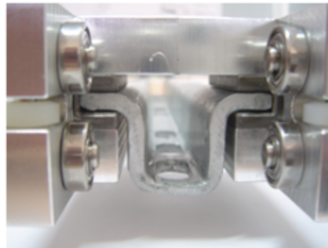
Bild Nr.3 Prüflehre- Aufschieben.