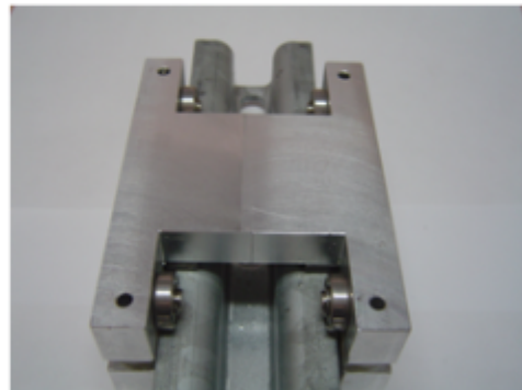
Bild Nr.4 Prüflehre über die gesamte Länge des Profils ziehen.