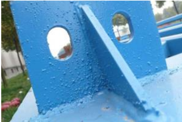
Bild 21: Schweißspritzer