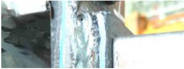
Bild 10: Offener Endkraterlunker