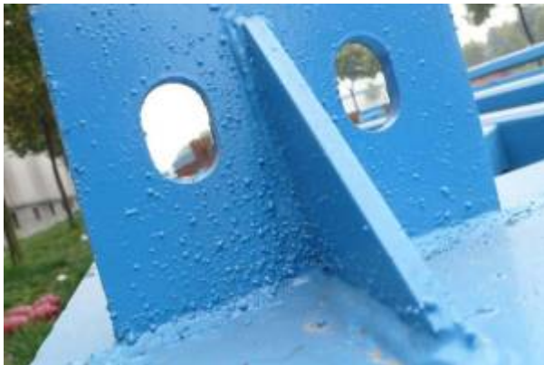
Bild 21: Schweißspritzer