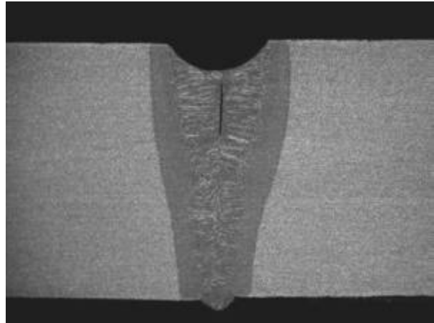
Bild 11: Interdendritischer Lunker einer Elektronenstrahlschweißnaht