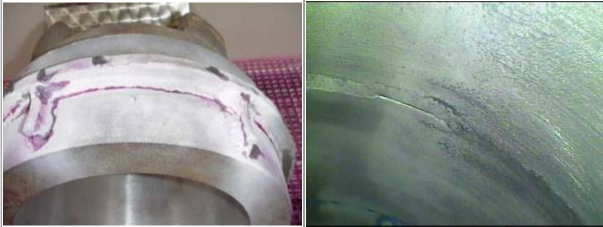
Bild 12. Bindefehler zur Oberfläche hin offen