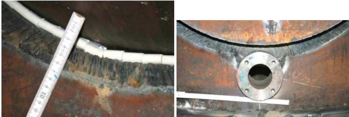
Bild 2: Nahtvorbereitung mangelhaft..... Bild 3: Nahtvorbereitung mangelhaft, Schweiß- und Zusammenbaufolge nicht beachtet.