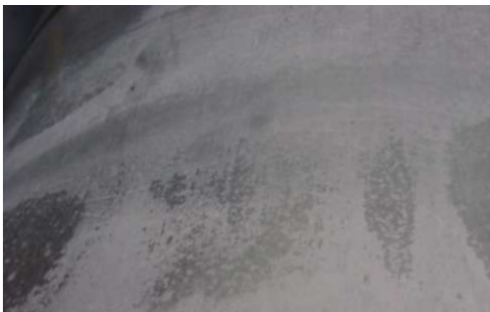
Abb.2: Flächiger Weißrost auf einem Verzinktem Blech

Hierzu ist die gesamte Oberfläche sorgfältig mit harten Nylonbürsten zu behandeln und mit reinem Wasser kräftig nachzuspülen. Die weitere Behandlung hängt vom Ausmaß und Grad der Schädigung ab. Bei, mittels Schichtdickenmessgerät messbarer, deutlicher Verringerung der Zinkschichtdicke kann es erforderlich sein, den ursprünglichen Korrosionsschutz durch das Auftragen geeigneter Beschichtungen wiederherzustellen. In der Regel lässt sich bei starkem Weißrostbefall die einheitliche Optik der Zinkoberfläche nicht wieder erreichen. Weißrost kann auch durch Abbeizen der Zinkschicht beseitigt werden. Durch Abwischen mit einer schwach konzentrierten Schwefelsäure kann oberflächlich der Belag entfernt werden. Anschließend gründlich mit Wasser nachspülen und trocknen.