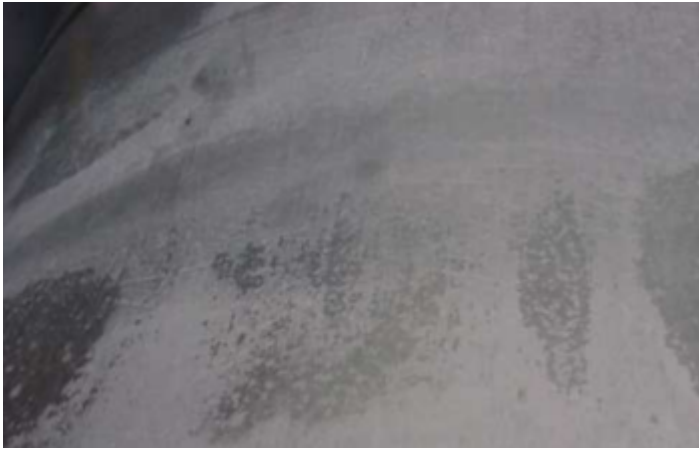
Abb.2: Flächiger Weißrost auf einem Verzinktem Blech