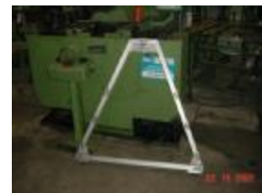
Prüflehre für Ondomat