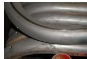
Lage der Schweißnaht